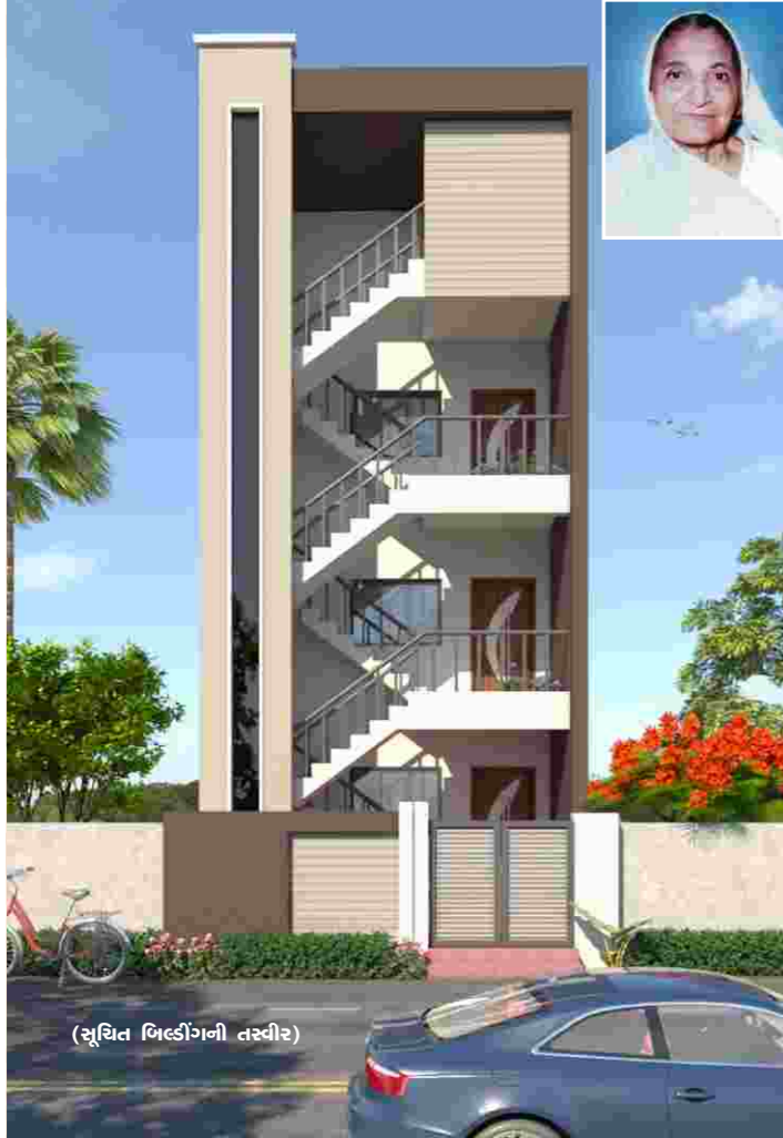
(સૂચિત બિલ્ડીંગની તસ્વીર)

શ્રીમતી સૂરજબેન લક્ષ્મીદાસ મહેતા વિધવા પુનઃવસન ભવન